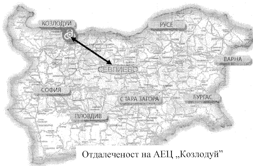
Отдалеченост на АЕЦ „Козлодуй“